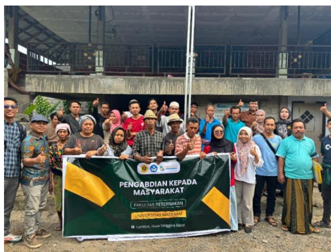
Gambar 1. Penyampaian materi perencanaan usaha dan manajemen pengolahan pakan sapi potong berbasis bahan lokal

Dari sisi kelembagaan, kelompok memiliki potensi untuk mengelola pakan secara kolektif karena anggota berada dalam wilayah yang relatif berdekatan dan memiliki akses terhadap jerami padi, rumput, tongkol jagung, dedak padi, dan lamtoro. Potensi ini menjadi modal penting untuk membangun sistem bank pakan sederhana, misalnya melalui pengumpulan bahan berserat setelah panen, pembelian molases dan suplemen probiotik secara bersama, serta pembagian tugas dalam proses pencacahan, pencampuran, dan penyimpanan. Dengan pendekatan kelompok, biaya pengadaan bahan tambahan dapat ditekan dan ketersediaan pakan dapat direncanakan lebih baik.